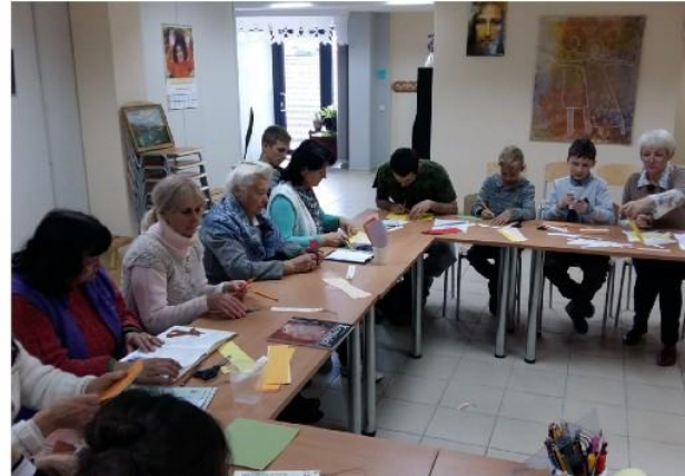
ESPAÑA e LITUÂNIA - Encontros Públicos sobre vegetarianismo

Tenham a amabilidade de compartilhar este Boletim da OSSI com a família e amigos.