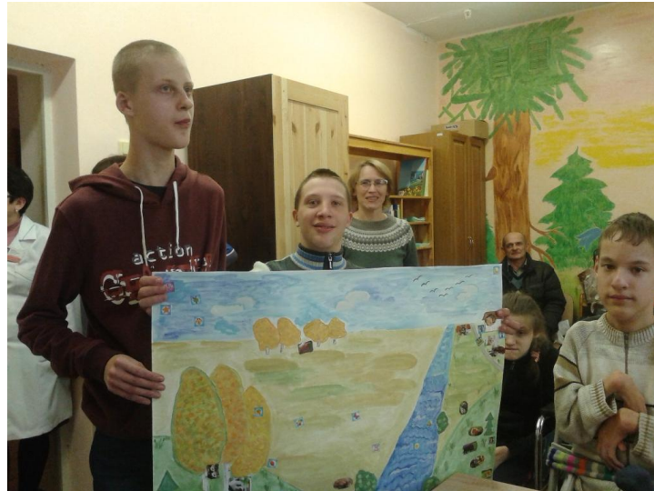
BELARUS aula de EVHSS sobre o Amor pelos Animais para crianças com debilidade física e mental