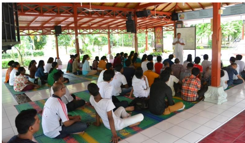
INDONESIA - JOVENS ADULTOS da OSSI falaram sobre a importância de ser vegetariano

Em El Salvador, Indonésia e Eslovênia foram feitas palestras sobre a importância de ser vegetariano e na França se conduziram círculos de estudo para adultos sobre este tema.