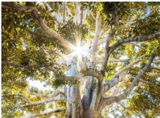
EDUCAÇÃO EM VALORES HUMANOS “UM CAMINHO PARA A VIDA” (Itália, 2021-22-23)